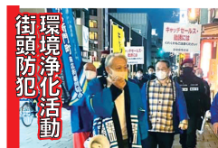
街頭防犯 環境浄化活動