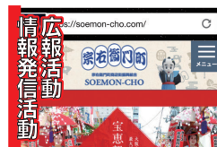
広報活動 情報発信活動