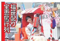
宝恵駕行列 福笹配り