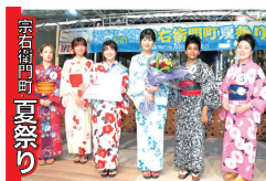
宗右衛門町夏祭り