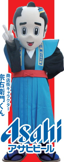
商店街キャラクター 宗右衛門くん