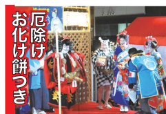
厄除け お化け餅つき